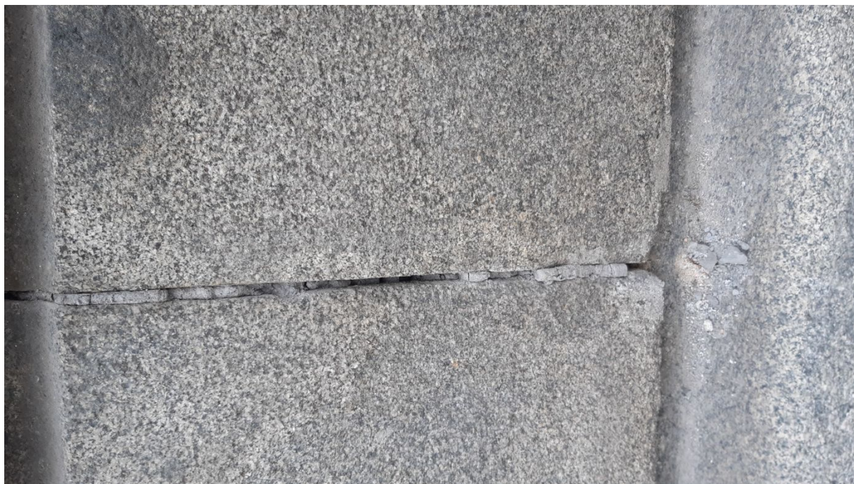
Uvolněné spáry a hrany žulových bloků.

zpracování restaurátorského záměru na opravu kamenných prvků na fasádách budovy „B“ krajského úřadu v Pardubicích na náměstí Republiky čp. 12