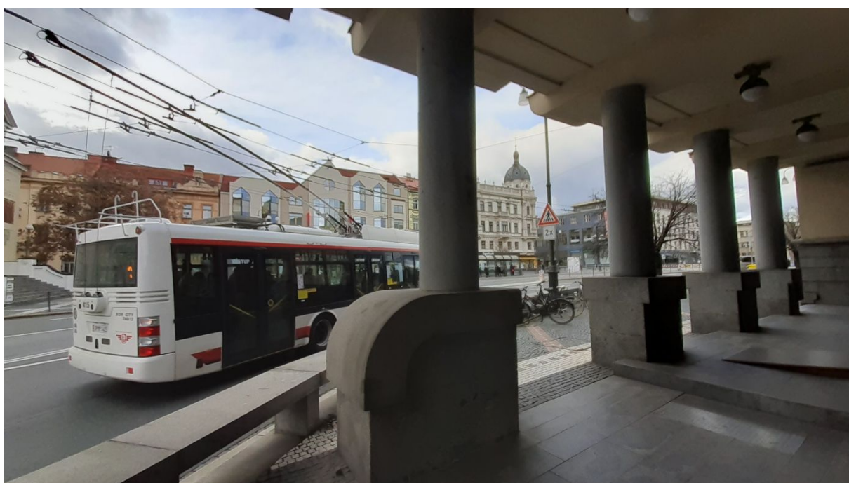
Sloupy u hlavního vchodu.